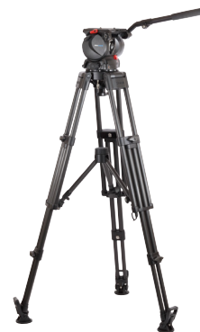
SX300 雲台 + TTH1502C 3段カーボン三脚 + TML150 mid-level spreader (floor pad付属)