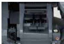
パン・ブレーキオン チルト・ブレーキオンの状態