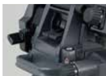
カメラマン側にある パン・チルトドラッグノブ