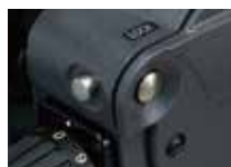
チルトロックピン・解除ボタン